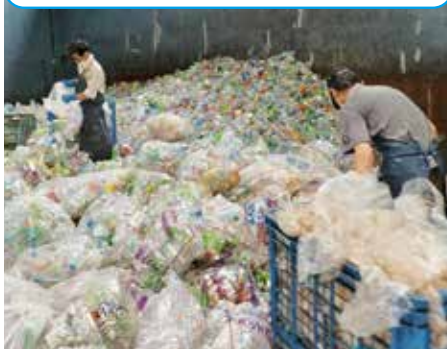
ペットボトルの破袋及び選別業務