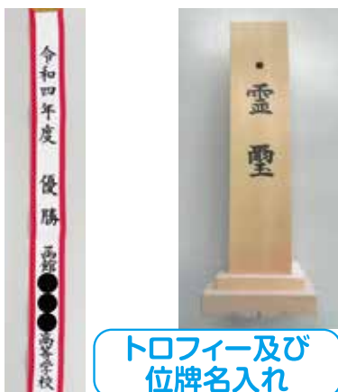
トロフィー及び位牌名入れ