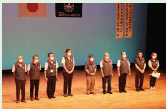
安全・適正就業委員

最後に安全・適正就業委員の紹介がなされ平穏なうちに閉会の運びとなりました。大きな事故もなく閉幕出来たことは大会に携わった関係者方々の徹底したコロナ対策のおかげだと思えます。