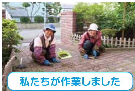
私たちが作業しました