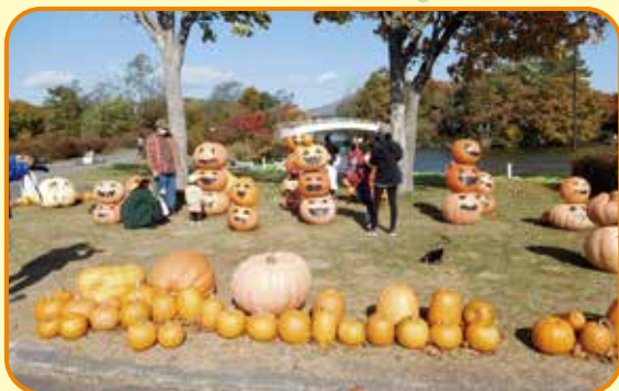
ハロウィンのシンボルたち