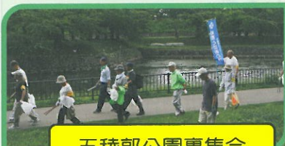
五稜郭公園裏集合

さすがは観光名所の五稜郭公園、ごみ も少なく天候にも恵まれて、総勢145名 で気持ち良く一汗かきました。